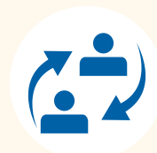
Stage e placement