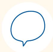
Servizio linguistico d'Ateneo