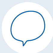
Servizio linguistico d'Ateneo