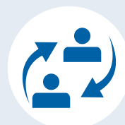
Stage e placement