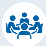
Orientamento e tutorato