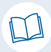
Libreria e biblioteche