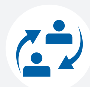
Stage e placement